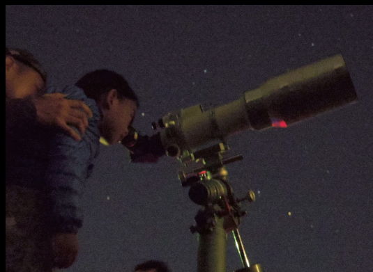
九州・山口星まつり in OKAGAKI

岡垣サンリーアイでの第1部ではシンポジウムなどが、波津海岸での第2部ではゴスペルのライブや「北斗の水くみ」の観望会が行われました。